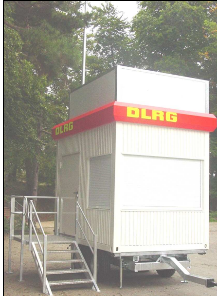
Mit geschlossenen Rolljalousien