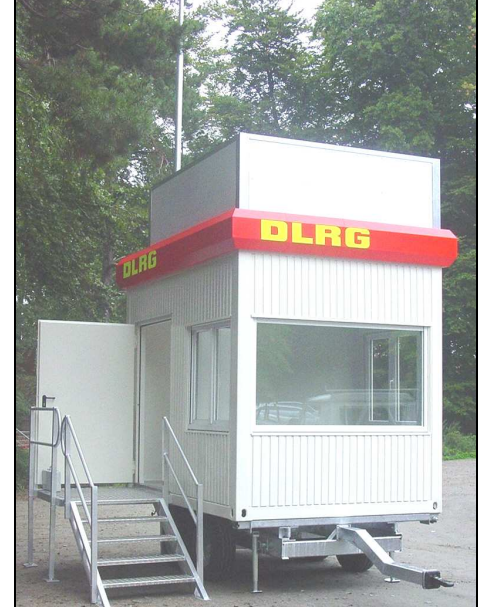
ALU - Seitenpodest